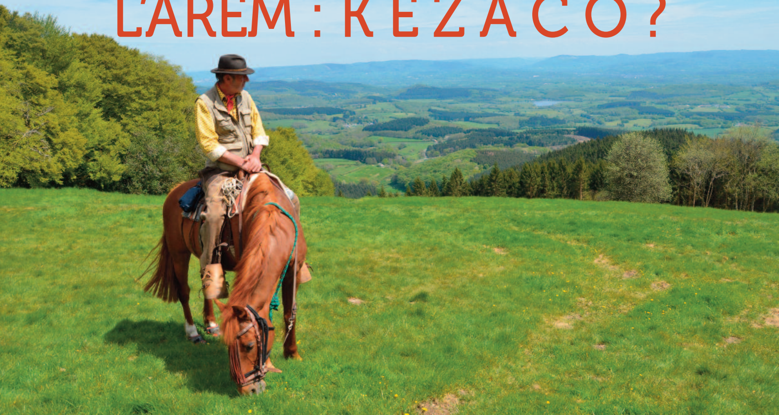
Cavalière au Mont Beuvray.

L' AREM (Association pour la Randonnée Equestre en Morvan) - association fondée en 1990 - a pour objet la pratique, l'organisation et la promotion du tourisme équestre en Morvan. Elle est financée par les cotisations de ses membres et les subventions des collectivités. Son siège social se trouve à la Maison du Parc du Morvan, à Saint Brisson.